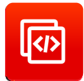
增强型 AT 命令集